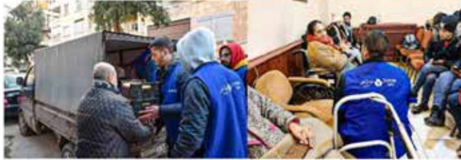
Foto's: Dorcas-personeel dat voedsel levert in tijdelijk onderdak in Aleppo (links), Dorcas-personeel praat met vrouw in rolstoel bij tijdelijk onderkomen in Aleppo (rechts)