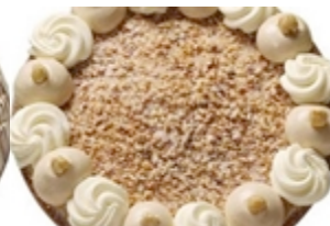
Hazelnoot de luxe