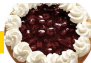
Kersen de luxe