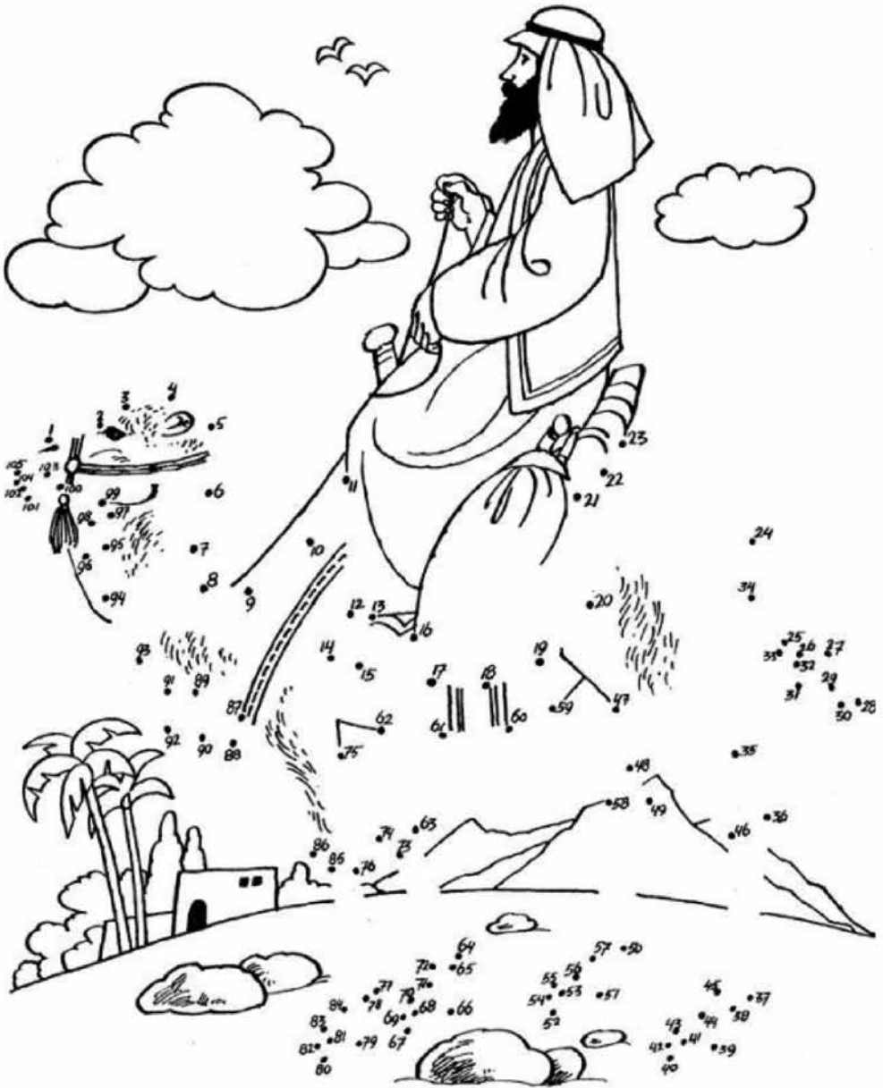
Abraham de herderskoning